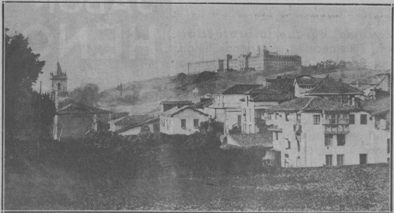
Comillas, la encantadora villa montañesa, ofrece a los ojos del viajero admirables perspectivas...