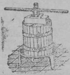
Prensas para uva y manzana desde 70 Ptas. Estrujadoras para uva. Machacadoras para manzana. Precio catálogo MATTHEWS GRUBER. ALBAID. Alas 5. Matías 74 al 13.

CURSOS ECONOMICOS de Alemán, Inglés, Francés, Traducciones, Correspondencia, Lecciones particulares y a domicilio. KIRCHER, Blanca, 4.