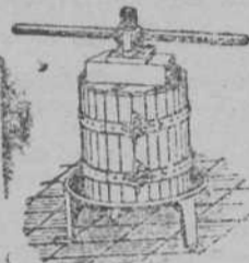
Prensas para uva y manzana desde 70 Ptas Estrujadoras para uva Machacadoras para manzana Punto de venta: «MATHIS» S.L. SILBAO, Avda. S. María 24 y 25

«CITROEN», 5 HP., trebol, 1.500 pesetas; «Fiat», 8 HP., roadster, dos asientos, y «Citroen», B 14, cupé, se venden. San José, 6, garaje.