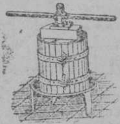
Prensas para uva y manzana desde 70 Ptas. Estrujadoras para uva Machacadoras para manzana. Fabricación: MATIAS GROSSE. BILBAO, Alameda de Zamora 70 y 81.

LECCIONES particulares domicilio: Contabilidad, Taquigrafía, Comercio, por profesor especializado. Precios económicos. Compañía, 13, tercero.