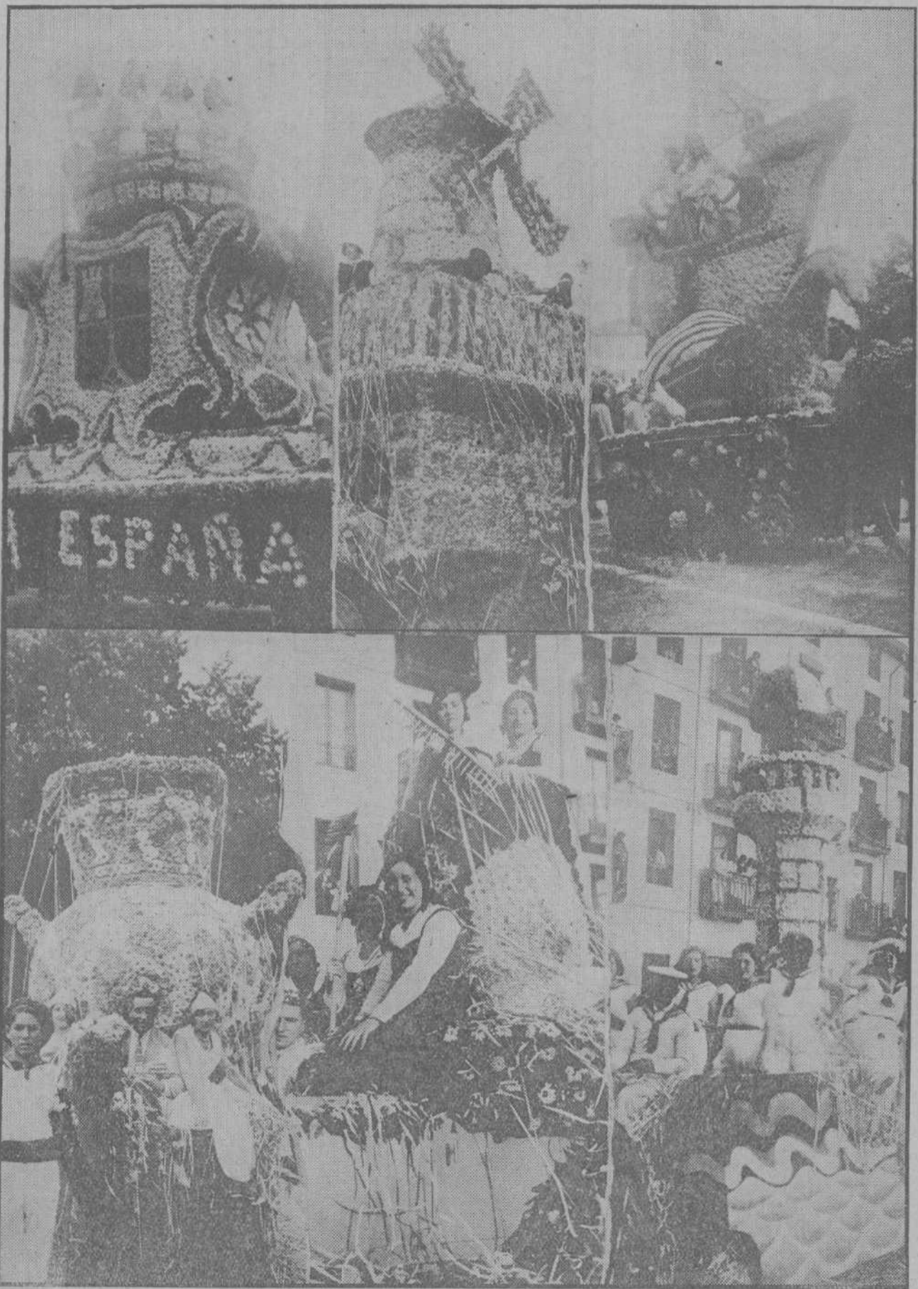
DE LA BATALLA DE FLORES DE LAREDO.—Las carrozas premiadas: «Escudo de la República», primer premio; «Molino de viento», segundo premio; «Naveta del siglo XV», tercer premio; «Jarrón japonés», cuarto premio; «Aromas de la Tierra», octavo premio; «Faro», presentada, fuera de concurso, por la Sociedad de Pescadores laredanos.

En estas circunstancias, España tiene interés en defender al metal-plata; en contribuir a la campaña que realizan algunos economistas para que se restablezca en todo el mundo el bimetalismo;