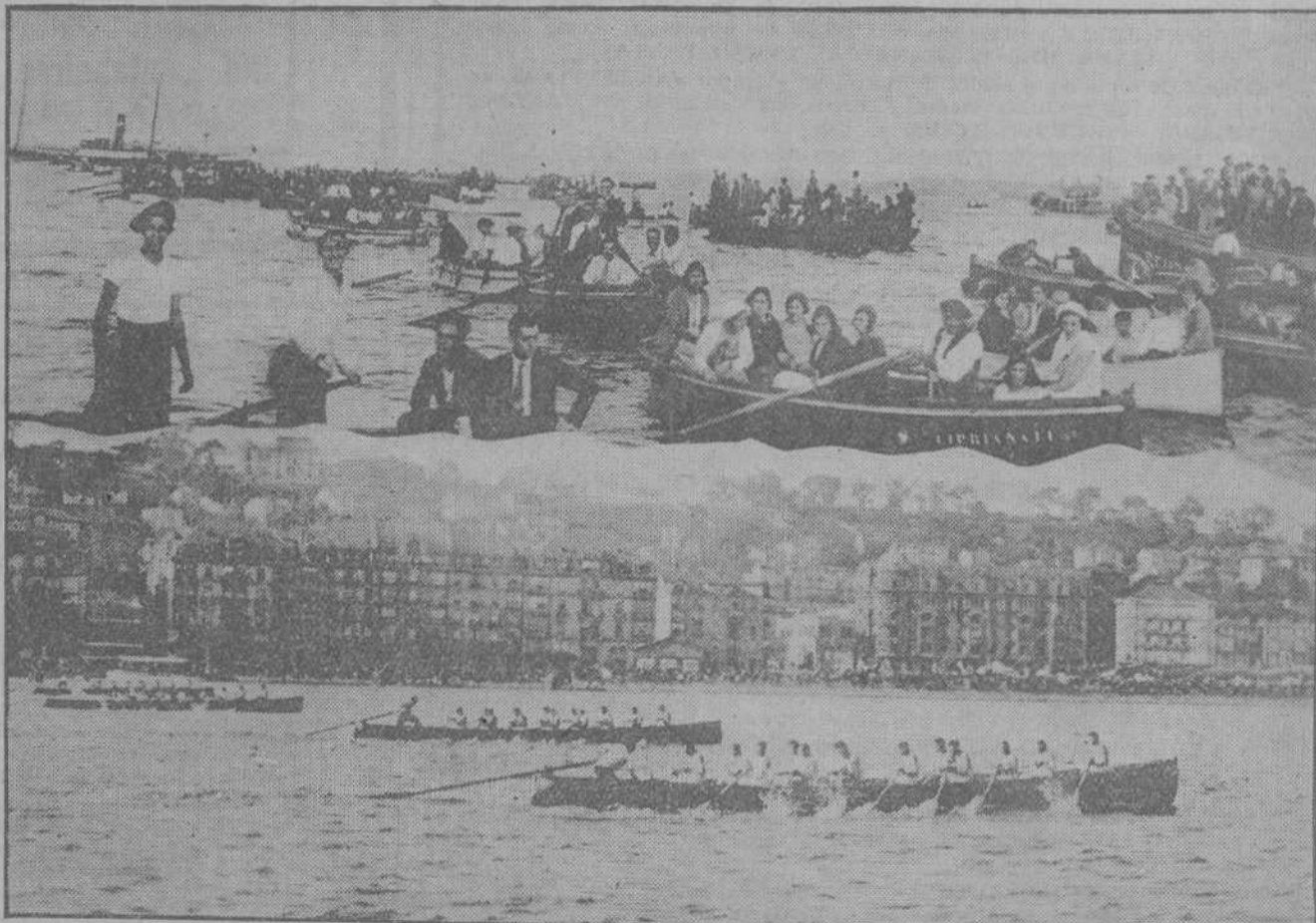
DE LAS REGATAS DEL DOMINGO.—Arriba, un aspecto de la parte Sur de la bahía, repleta de embarcaciones que siguen con interés la regata. Abajo, el interesante momento de la salida de las cuatro traineras.