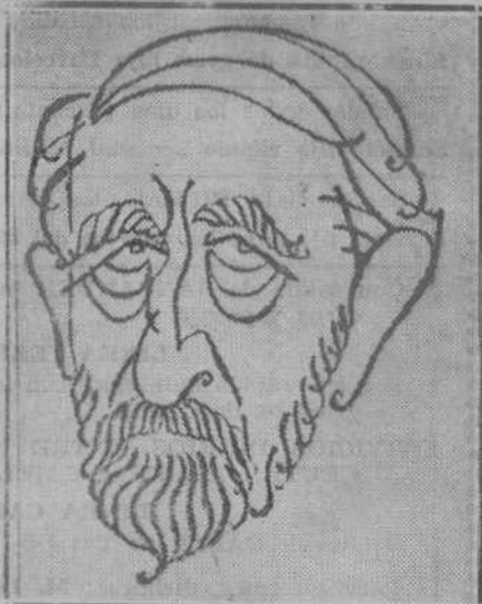
He aquí la testa noble y augusta de don Manuel Bartolomé Cossío, insignia de la nueva España.

Terminada su misión accidental, Cossío vuelve nuevamente a su trabajo docente. Los años y los quebrantos morales son, en cierto modo, implacables con él. Le duele el dolor de España, el dolor del cuerpo, el dolor íntimo.