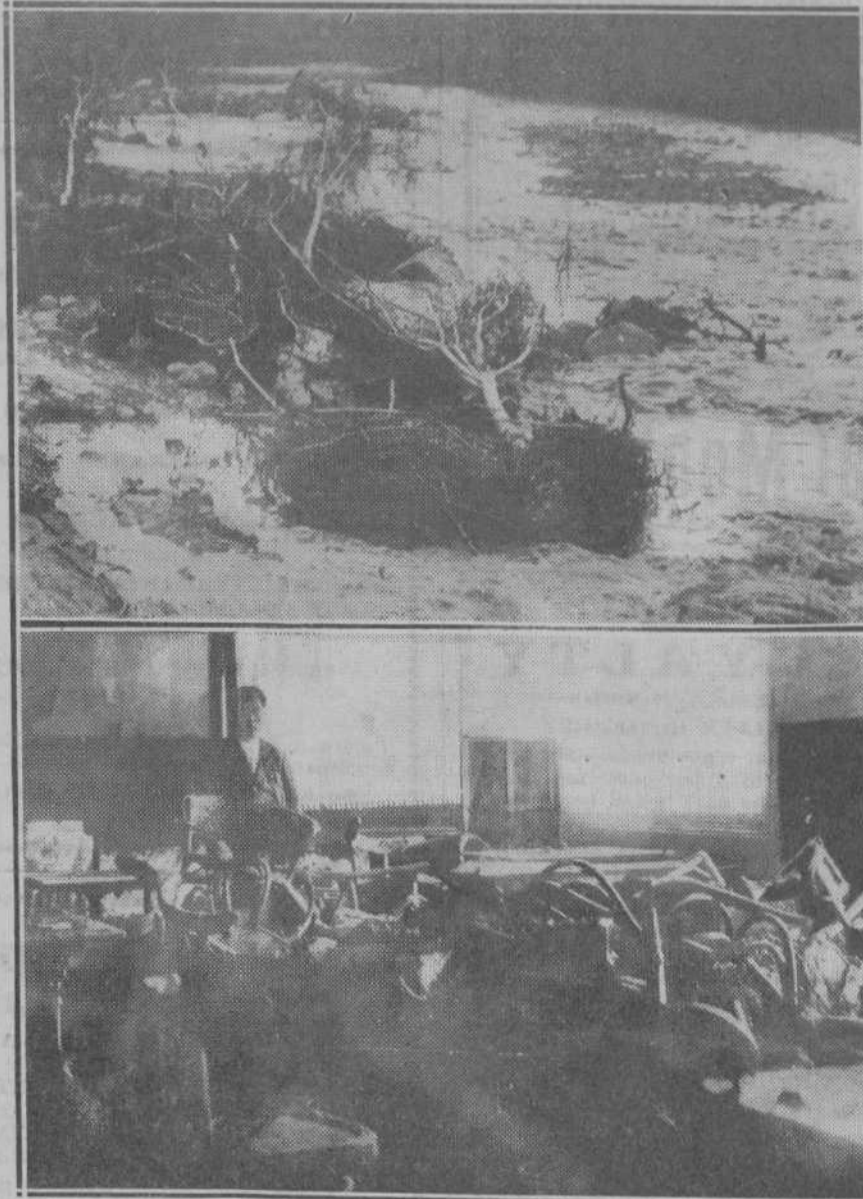
LA OBRA DESTRUCTORA DEL TEMPORAL.—Las aguas desbordadas anteayer no respetaron ni los reductos naturales ni los artificiales... Arriba, los límites de un riachuelo fueron considerablemente desbordados... Abajo, el café Villafranca, de Ontaneda, uno de los establecimientos más perjudicados por el temporal...

Advertimos a los señores que favorecen con el envío de originales que no hemos solicitado, que nos es imposible mantener correspondencia acerca de ellos.