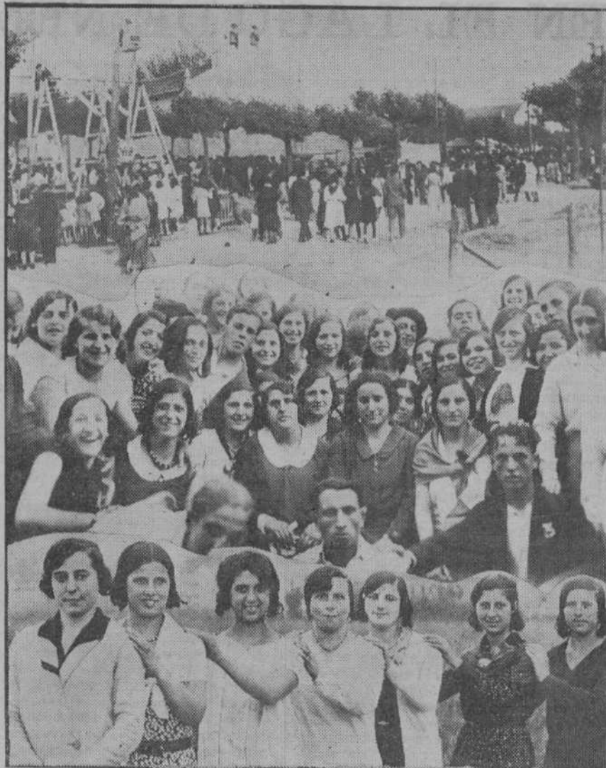
JUBILO POPULAR.—En el pueblo existe una fuente perenne de optimismo. En un fondo de artilugios de verbena y feria, se divierte el pueblo santanderino durante la tradicional romería de San Pedro. Muchachas lindas y gentiles añaden encantos a este regocijo popular.

CONSULTORIO DENTAL P. CITOLER ODONTOLOGO Plazuela del Príncipe, 10.—Teléfono 1855.—De 10 a 1 y de 3 a 7. RAYOS X