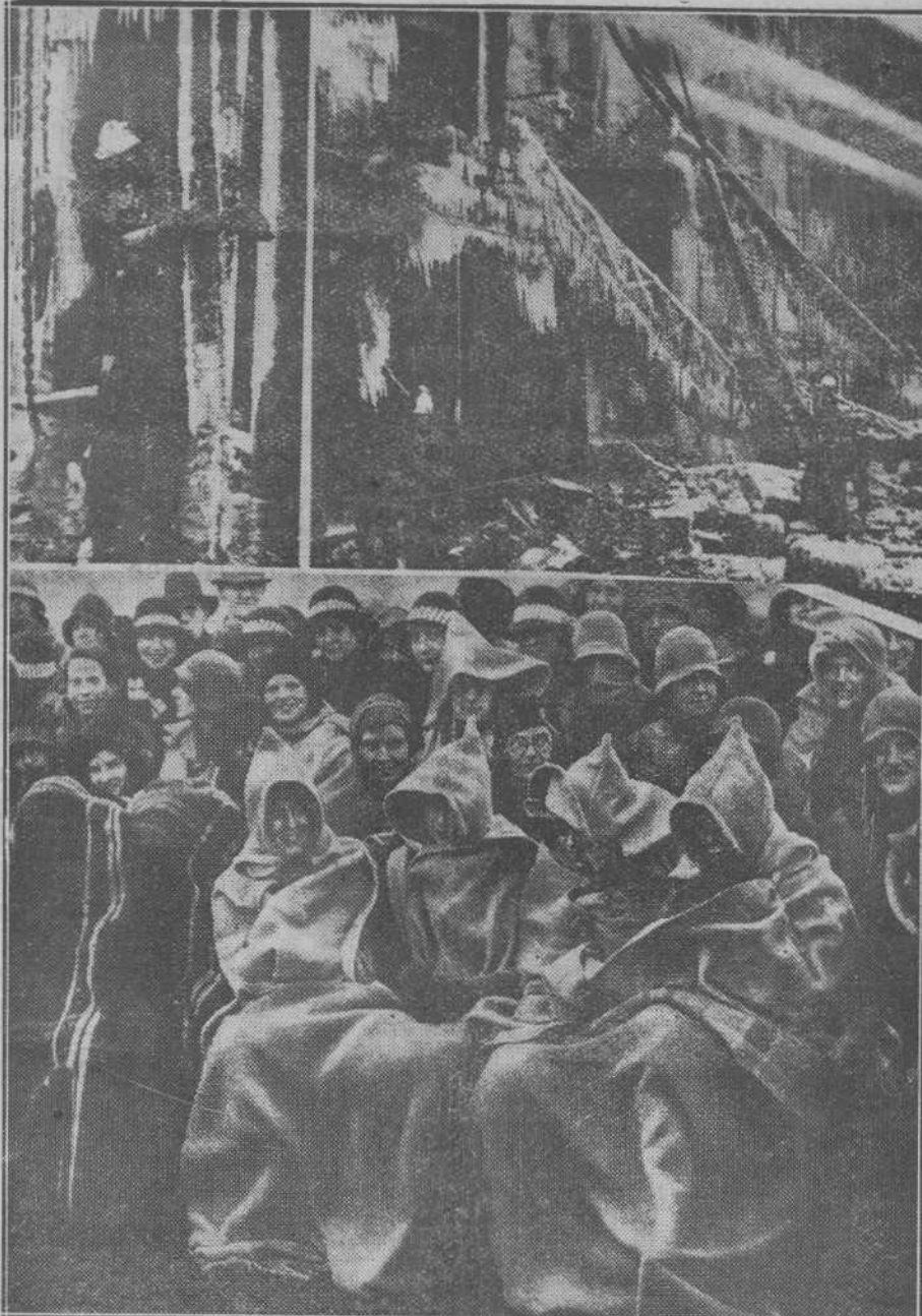
LA ACTUALIDAD EN EL EXTRANJERO.—Dos notas del frío que disfrutaban por esos países de Dios. En un incendio en Towez-Bridge, los bomberos tropezaron con grandes dificultades para la extinción porque el agua, al salir de las mangas, se helaba instantáneamente.—La otra foto recoge un aspecto de la tribuna durante el "match" femenino de hockey entre Inglaterra y Escocia. ¿No es cierto que esas señoritas encapuchadas lo hubieran pasado mejor en casita, al amor de la estufa? Pero ¡ah, el deporte!, y ¡ah, la foto nueva, embutidas en un traje saco que a lo mejor se pone de moda!