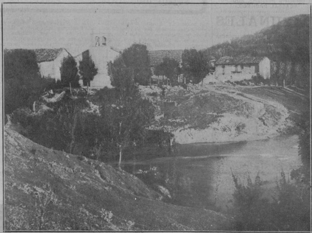
He aquí un encantador rincón de la provincia: el nacimiento del Ebro, que será, en cuanto Santander lo solicite, declarado "Sitio de interés nacional". Santander verá si ello le conviene para el fomento del turismo.

Advertimos a los señores que nos favorecen con el envío de originales que no hemos solicitado, que nos es imposible mantener correspondencia acerca de ellos.