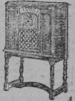
RCA 80. - Super-heterodyna eléctrico, válvulas de rejilla blindada, altavoz electrodinámico.