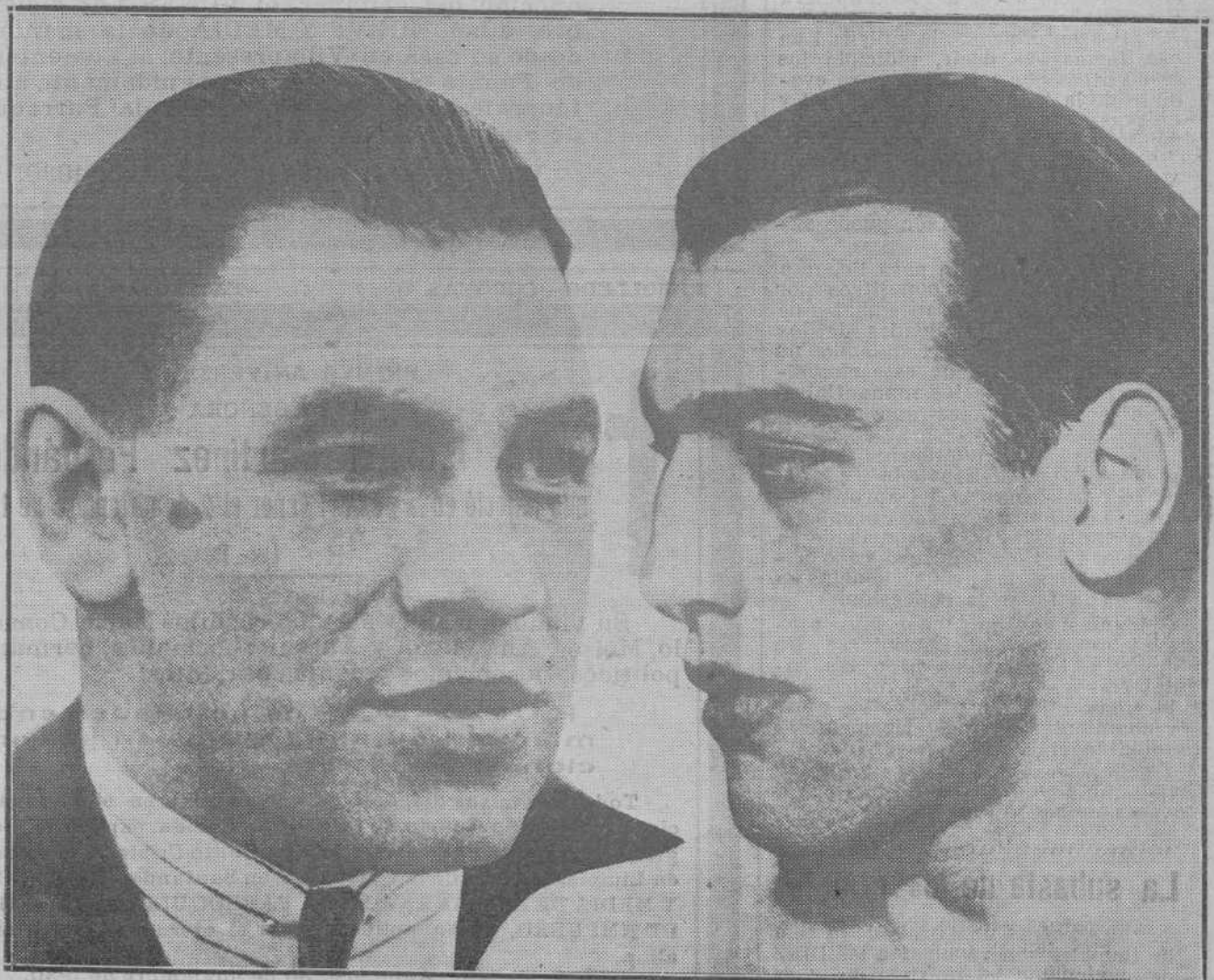
EL "MATCH" PAULINO-CARNERA DE HOY.—Esta tarde, en el magnífico estadio de Montjuich, capacitado para 100.000 personas, se enfrentarán los famosos boxeadores mundiales Paulino Uzcudun y Primo Carnera en interesante pelea, de cuyo resultado publicará el martes LA VOZ DE CANTABRIA una detallada información.

«Arre, borrico!», jota (primera vez).—Luna.