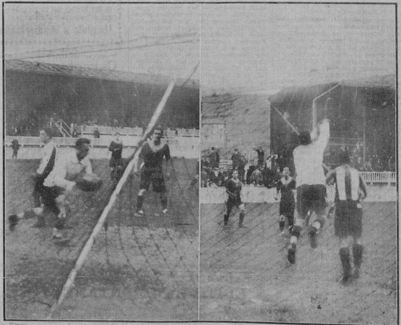
EL DOMINGO, EN LOS CAMPOS DE SPORT.—Dos felices intervenciones de Crespo, portero del Eclipse.

Advertimos a los señores que nos favorecen con el envío de originales que no hemos solicitado que nos es imposible mantener correspondencia acerca de ellos.