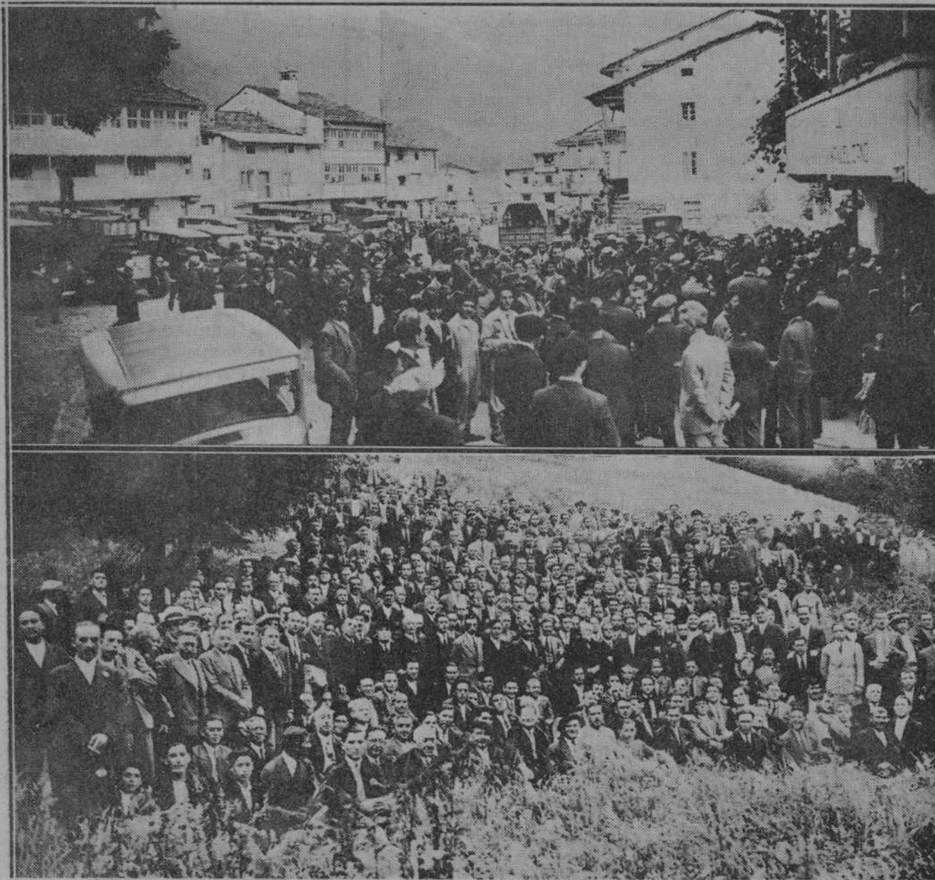
HOMENAJE DE LOS DEMOCRATAS MONTAÑESES AL DOCTOR MADRAZO.—Un aspecto de la plaza de la Vega, a la llegada de los excursionistas.—Un grupo de asistentes al acto rodeando al sabio doctor, en el jardín de la finca de éste.