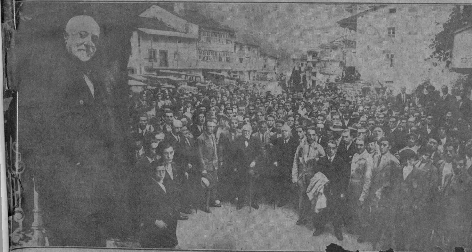
HOMENAJE DE LOS DEMOCRATAS MONTANESES AL DOCTOR MADRAZO.—EL