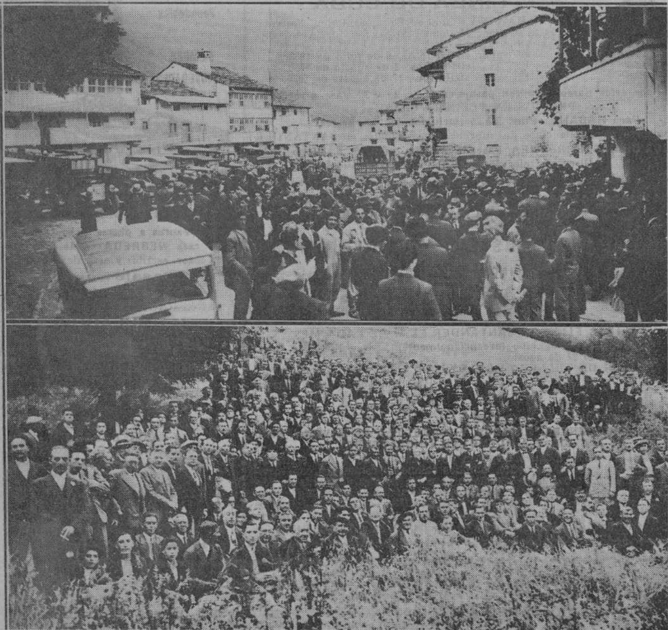
HOMENAJE DE LOS DEMOCRATAS MONTAÑESES AL DOCTOR MADRAZO.—Un aspecto de la plaza de la Voz de la Plaza de los excursionistas.—Un grupo de asistentes al acto rodeando al sabio doctor, en el jardín