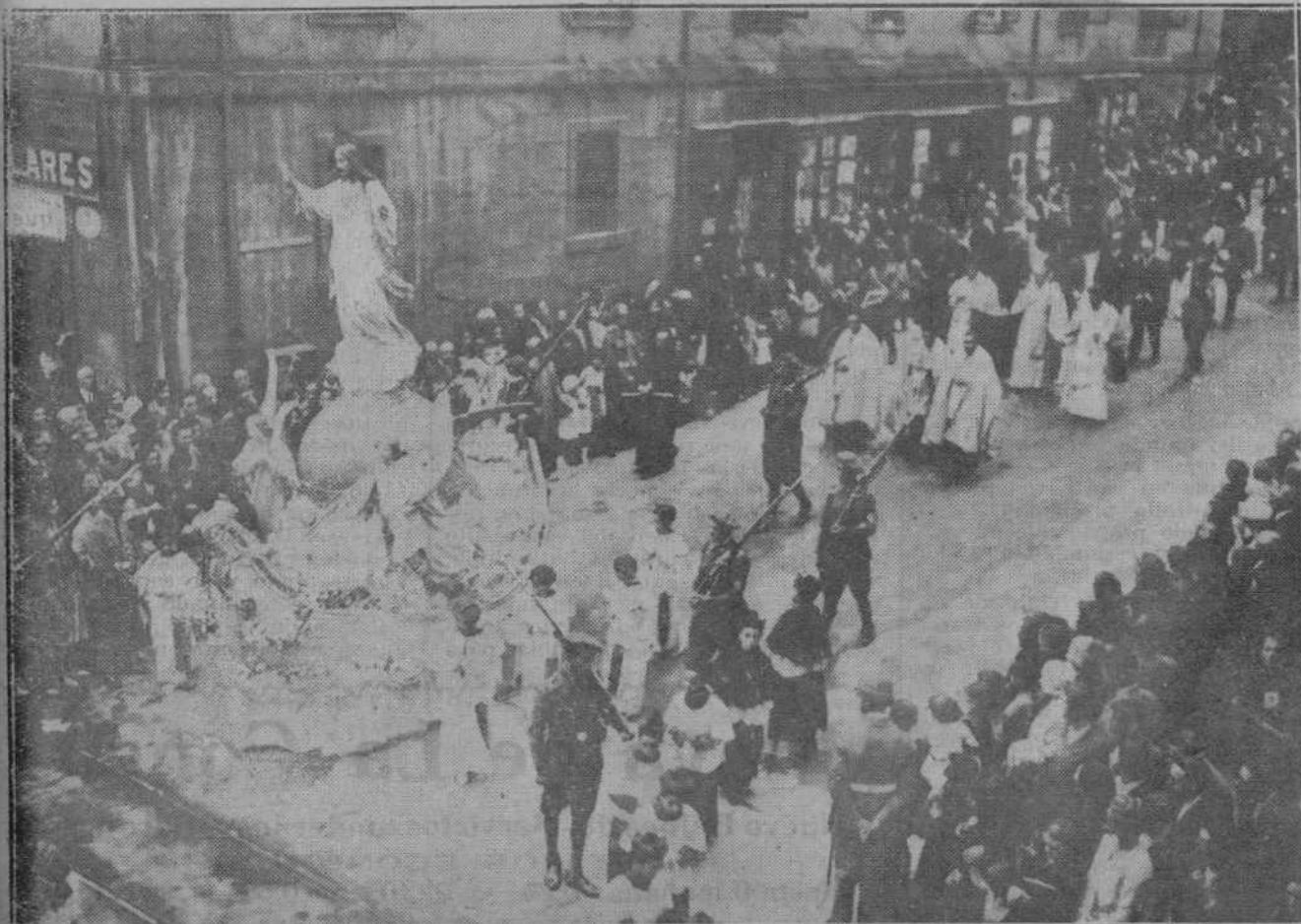
UN MOMENTO DE LA SOLEMNE PROCESION DE AYER TARDE.—(Foto Alejandro)

El día 30, a las nueve de la mañana, ejercicio escrito de los alumnos que soliciten reválida durante todo el día 28.