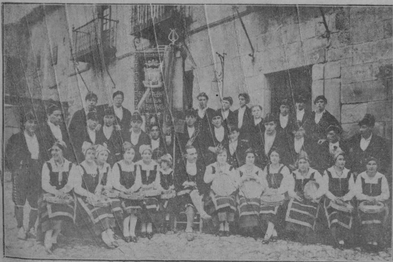
La popular agrupación "El Saber de la Tierra" ha incorporado elemento femenino a su notable coro, con las naturales ventajas artísticas. Alejandro ha obtenido la presente foto del coro montañés en su nueva constitución.

Hay grandeseo, por parte del público en presenciar este festival, ya que tiene el aliciente de que la popular agrupación ha incorporado a la misma once señoritas, las que, después de constantes ensayos, interpretan admirablemente la canción popular.