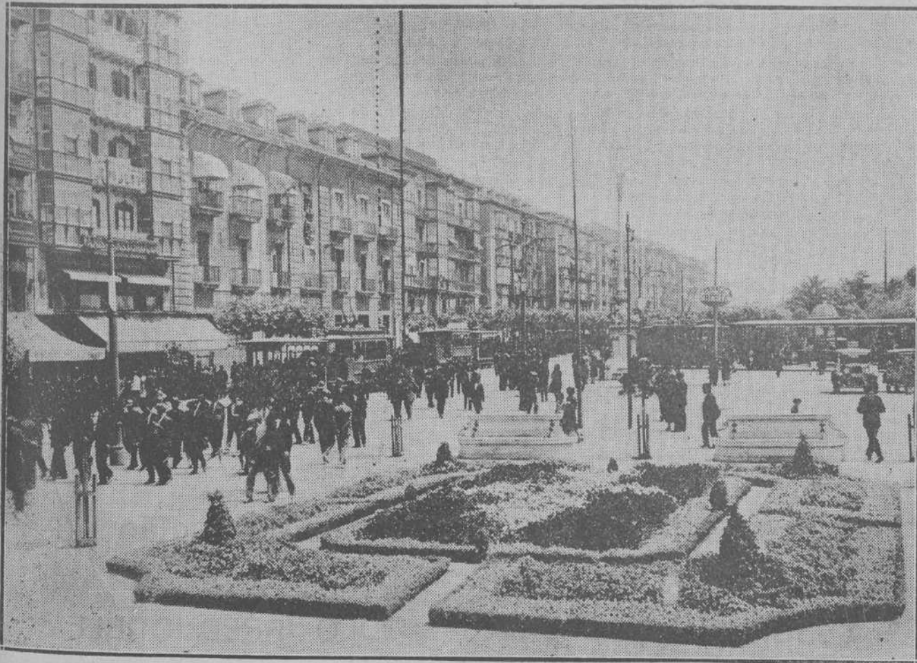
EL ENSANCHE DE UNA CALLE.—He aquí, gráficamente expresado, en qué consiste el proyecto de ensanche de la calle de la Aduana. La línea de puntos señala la parte que se pretende reducir del edificio en que se halla instalada la Delegación de Hacienda, y la línea negra, el límite actual de aquél.

El presupuesto extraordinario de más de cinco millones acudirá a remediar defectos y a perfeccionar y extender importantes servicios urbanos. La tendencia centrista de su aplicación—tendencia que han satisfecho también otras ciudades con iguales aspiraciones turísticas—antes acoge que rechazara la idea del mercadillo en el Sardinero, porque el Sardinero, en una buena parte del año, es el lugar más céntrico y con-