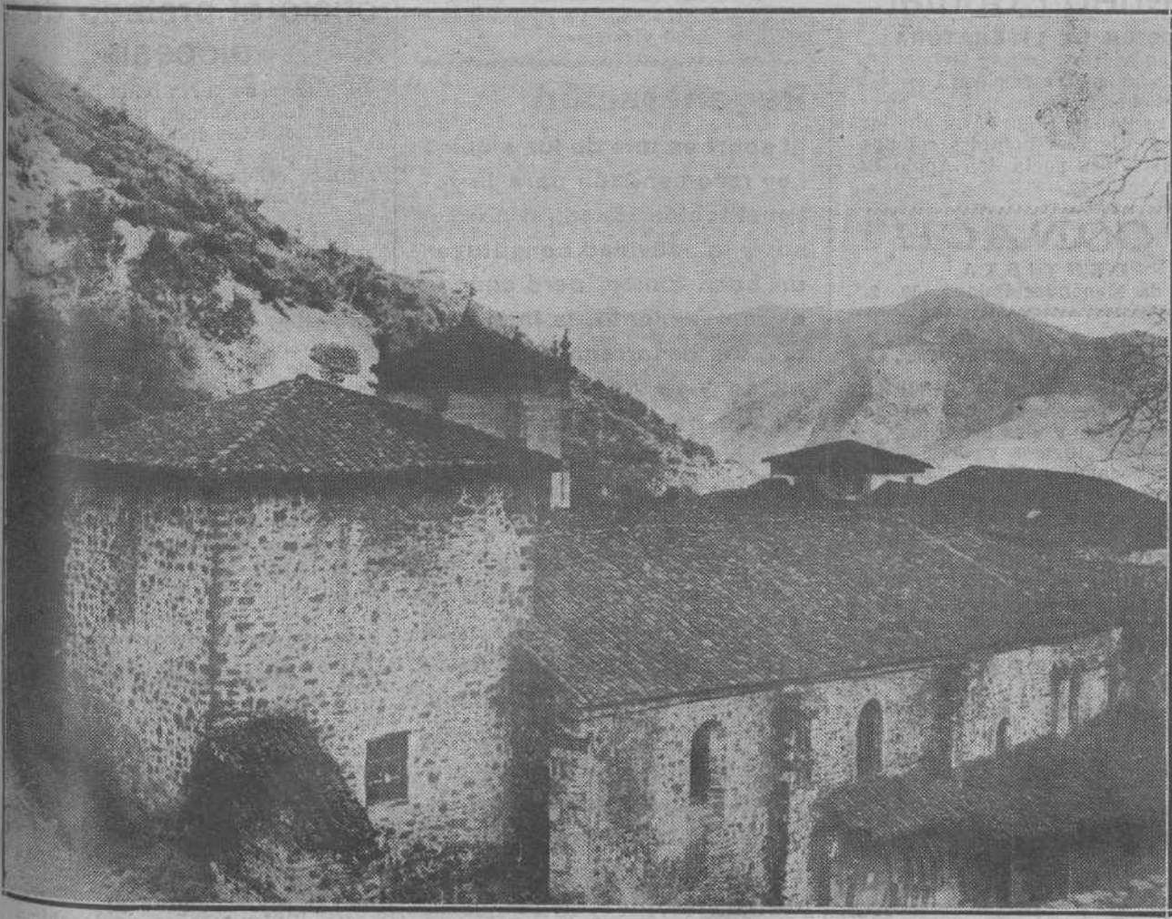
PAISAJES MONTAÑESE.—Un aspecto poco conocido, fotográficamente, del viejo e interesante ex monasterio de Santo Toribio de Liébana.

LEA USTED EN NUESTRAS PLANAS DE INFORMACION TELEFONICA LAS ULTIMAS NOTICIAS DE ESPAÑA Y EL EXTRANJERO