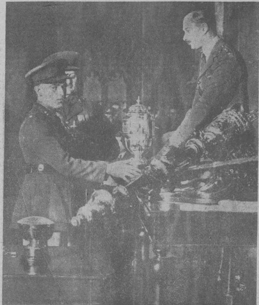
LA ACTUALIDAD EN EL EXTRANJERO.—El duque de Gloucester, hijo de los Reyes de Inglaterra, entregando la copa del Rey para Artillería pesada a la batería de la brigada Pembroke.

De epitafio en epitafio, el autor se supera. Véanse éstos: