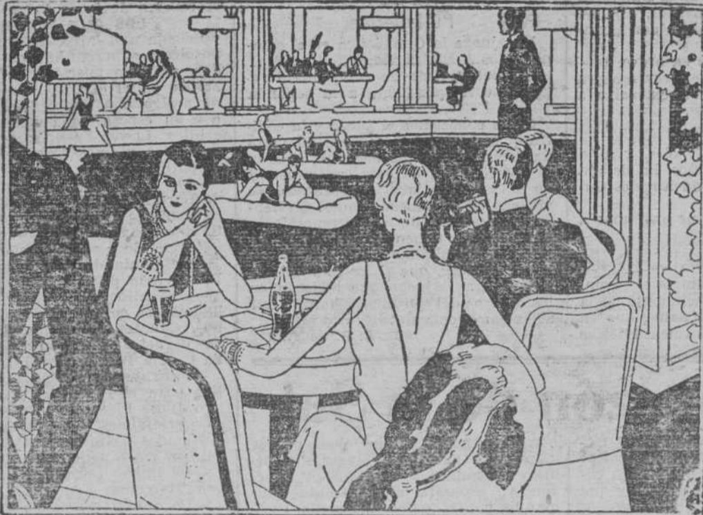
Saborear un vaso de Coca-Cola es un deleite del que no saben prescindir los paladares refinados.