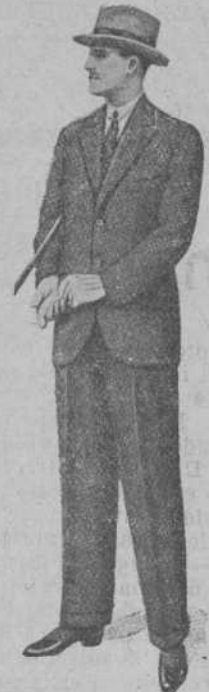
TRAJE LANA para hombre, desde 32 ptas. " niño " 10 "

Trajes driles para hombre y niño - Trajes para mecánicos Pantalones en todos los tamaños, de lana, driles y panas Guardapolvos, etc, etc, por muy poco dinero