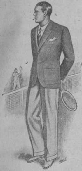
Americana y pantalón «Oxford» Gran novedad - Desde 29 pesetas.

CAMISERIA - CORBATAS PAÑUELOS - TIRANTES LIGAS - CALCETINES GORRAS - BOINAS