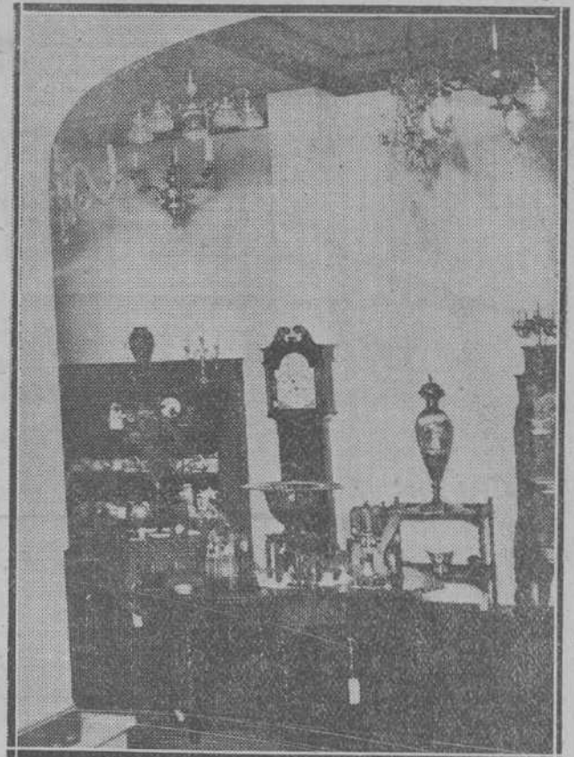
Cualquier rincón de la lujosa tienda tiene el encanto de la novedad y el lujo. El reloj de pared es digno del salón de un monarca...

Santander nunca ha podido tener la presunción de ir a la cabeza de las ciudades en lo que se refiere a la instalación de establecimientos modernos de comercio. Es raro, pero en tanto que en belleza y en urbanización, cada año avanza más, en este otro aspecto importantísimo que preocupa tanto en otras poblaciones, Santander no ha avanzado un solo paso. Todavía se ven en calles principales, tiendas anticuadas, con ciérrres viejos y sin ningún ornato exterior ni interior como si a sus dueños no les preocupase atraer a la clientela con la campanita alegre de lo moderno. Esto, que parece no tener importancia, ha dado lugar en no pocas ocasiones, a que otros comerciantes más animosos, hayan venido de fuera a hacer la competencia a los de aquí. La razón es poderosa y lógica: cuando en una ciudad se ve al comercio colocado a una altura principal no hay quien se atreva a mejorarle y queda evitada la lucha; cuando, por el contrario, da la sensación de arrastrar una vida miserable cualquiera se atreva a darle la batalla con tiendas mejores que han de sumar la clientela en razón directa del esfuerzo hecho para mejorar su aspecto.