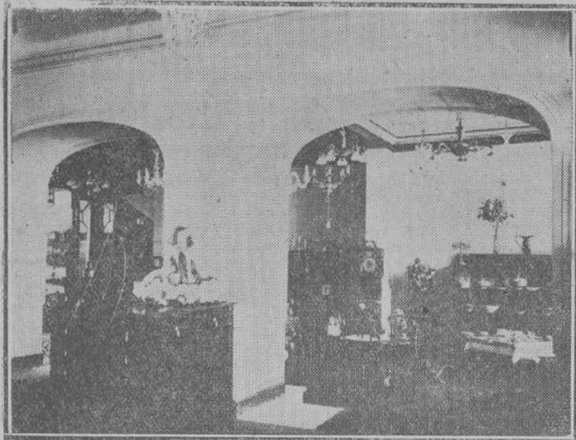
Dos arcos de bella traza dan paso a la tienda-museo, donde se expenden las más altas novedades de fantasía.