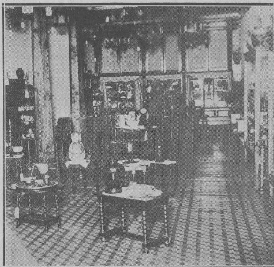
Entre los comercios de la calle de San Francisco destaca por su elegancia y buen gusto la Camisería y objetos de Arte «Mafor», recientemente instalada.