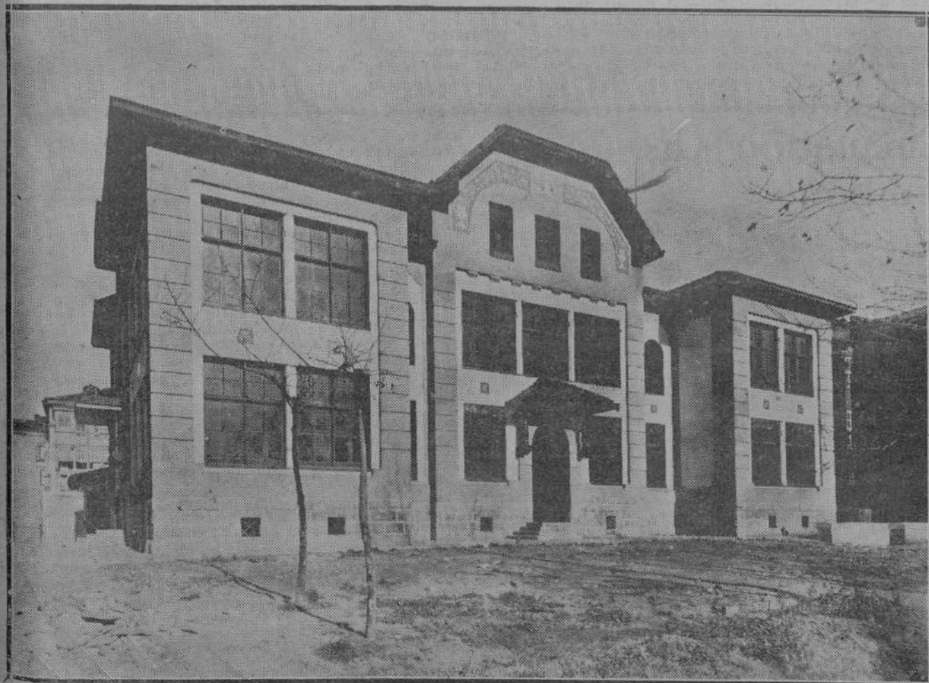
El grupo escolar "Menéndez Pelayo" se verá pronto animado por la alegría de los niños. Ese edificio, amplio y artístico, es el mejor homenaje al polígrafo sapientísimo, cuyo nombre lleva, y constituye, a la vez, un orgullo para Santander que, al abrir estas escuelas modelo, rompe una tradición de apatía y de abandono en cuanto se relaciona con la enseñanza primaria, pública y gratuita.