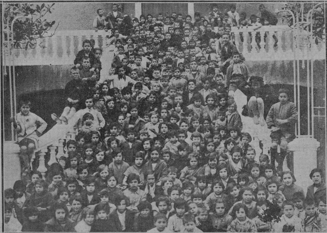
CASTRO-URDIALES.—Niños a quienes se da diaria comida en las Cantinas Escolares.

LEA USTED EN NUESTRAS PLANAS DE INFORMACION TELEFONICA LAS ULTIMAS NOTICIAS DE ESPAÑA Y EL ::: EXTRANJERO :::