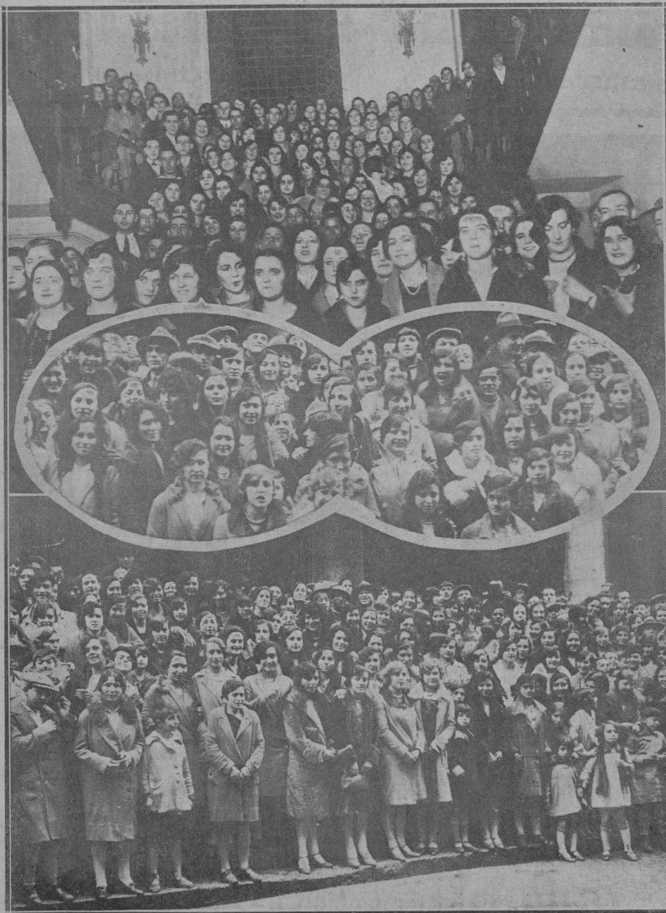
DE LA FIESTA DE LAS MODISTAS.—La escalera interior del Gran Casino durante el baile.—En el centro, las modistas al salir de la misa.—Una parte de la gran concurrencia femenina, en la escalinata de la iglesia de Santa Lucía, después de la misa celebrada con motivo de la fiesta de las modistas.

LEA USTED EN NUESTRAS PLANAS DE INFORMACION TELEFONICA LAS ULTIMAS NOTICIAS DE ESPAÑA Y EL EXTRANJERO : : : :