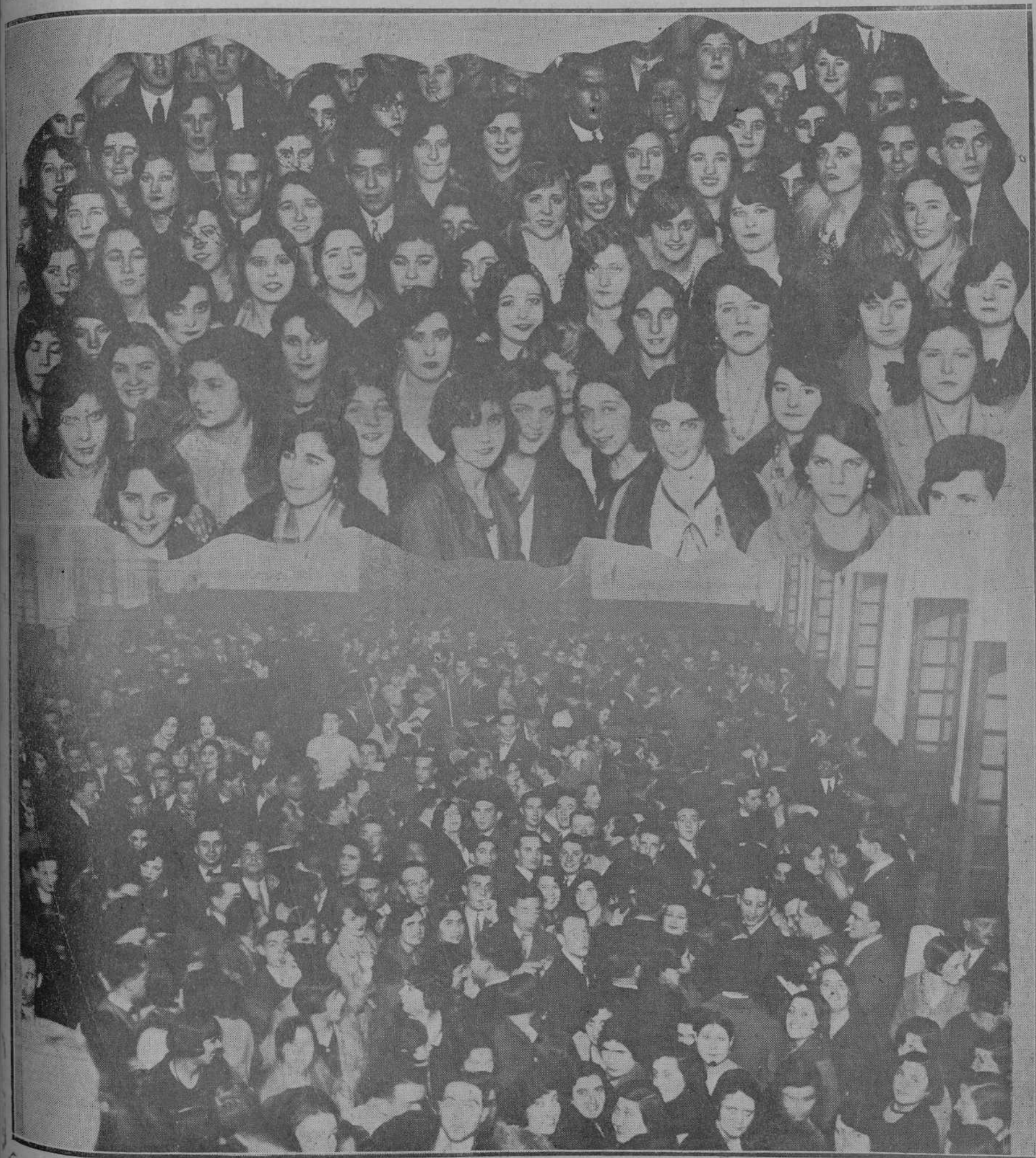
Caras bonitas y alegría sana, o lo que es lo mismo: fiesta de las modistas. Alejandro ha estado a punto de perder la suya al grabar en cinco las cabecitas llenas de ilusiones de estas mujercitas adorables.—Aspecto que ofrecía el "hall" del Casino durante el baile.

DIARIO GRÁFICO INDEPENDIENTE DE LA MAÑANA