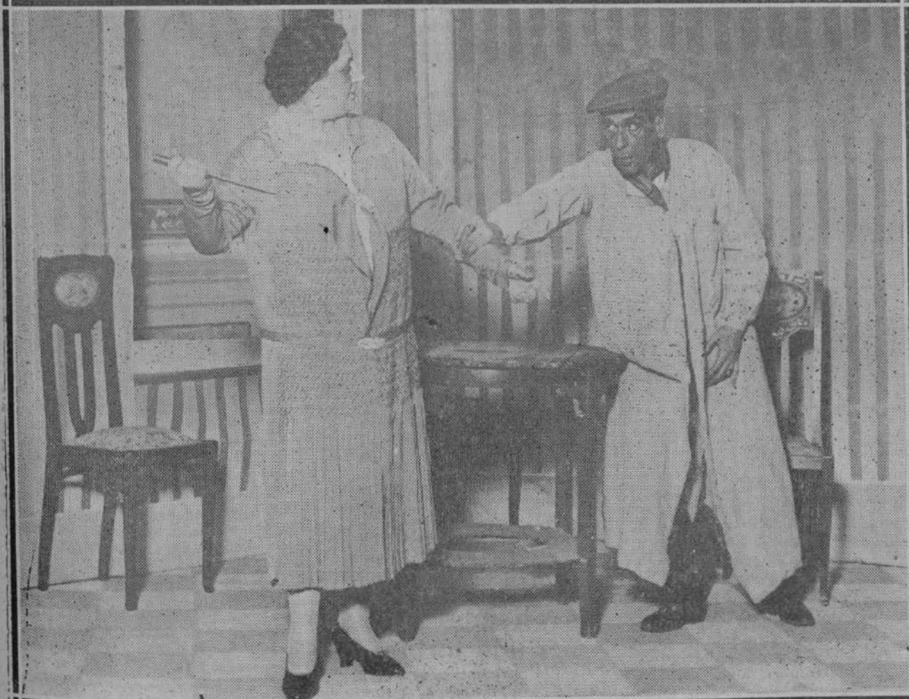
ANOCHÉ EN EL TEATRO PEREDA.—Una escena de la obra de Sánchez Carrere y Fernando Mora, titulada "La mala", que estrenó con gran éxito la compañía de Concha Catalá.