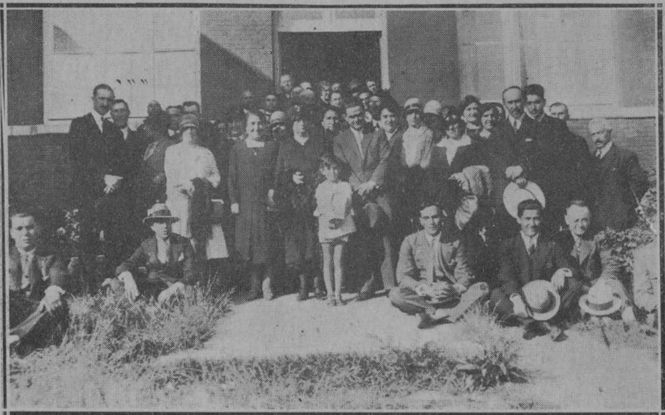
Fotografía obtenida por nuestro compañero "Teofastro", de los asistentes al cursillo pedagógico que se celebra en Valdecilla.

"Cantabria". Nada mejor que estos viejos trofeos para adorno del flamante Club. Lanzamos la idea como un "ballon d'essai, por si cae.