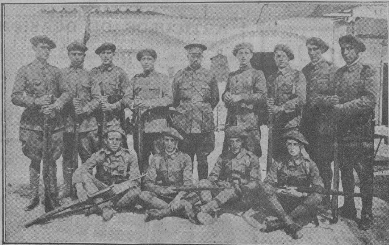
La patrulla del regimiento de Valencia que en el concurso de Tiro de Granada obtuvo el primer premio.