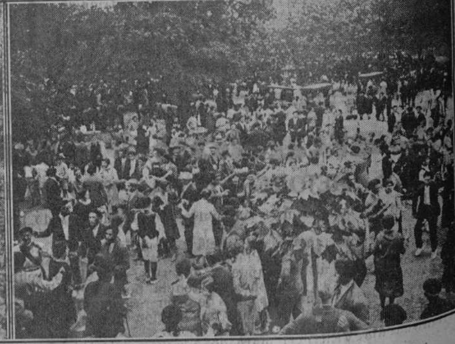
Las fiestas de Gama han tenido también este año una gran brillantez. Nuestro colaborador gráfico, Leoncio, nos envía estas cuatro interesantes notas de la popular romería.