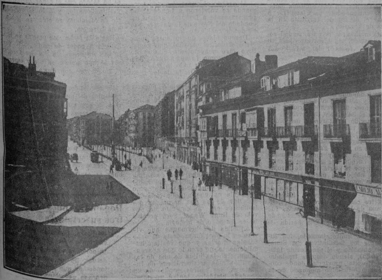
DEL SANTANDER ANTIGUO.—He aquí un aspecto de la antigua calle del Correo y de la entrada de la Alameda Primera. Todavía se ve la vía del tranvía de caballos y las casas de un piso que en la Alameda recordaban hace treinta años los orígenes humildes de nuestra ciudad.

De aquí harán excursiones a Madrid y Andalucía. También llegarán con dichos turistas, que es casi seguro que venga luego a Santander durante las fiestas de la regata Nueva York-Santander, varios periodistas americanos.