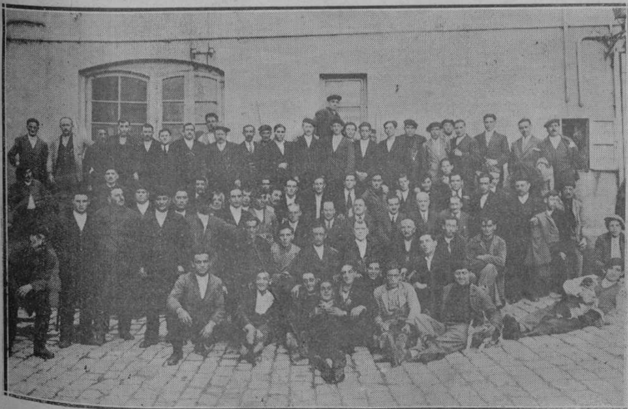
Alto personal, empleados y obreros de la fábrica de cervezas “La Cruz Blanca”, después de la fiesta celebrada ayer con motivo de las bodas de oro de la fundación de esta importante industria santanderina.

Nosotros hubiéramos querido que al cumplirse los cincuenta años de la Galerna del Sábado Santo y de la publicación de la famosísima Elegía, el Ateneo de Santander y el Ateneo Popular hubieran dado lectura pública a la obra maestra del autor de los “Heterodoxos”. Hubiera sido una manera de asociar la tradición de cultura del pueblo, a la tradición de sacrificio y de trabajo, a “los sórdidos harapos” pescadores “que hicieron grande, poderosa y rica” a Santander.