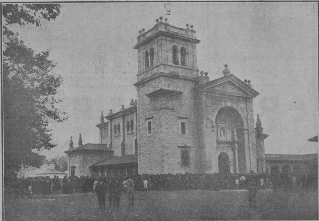
CONSTRUCCIONES MONTAÑESA S.—La moderna y magnífica iglesia de Los Corrales de Buelna.