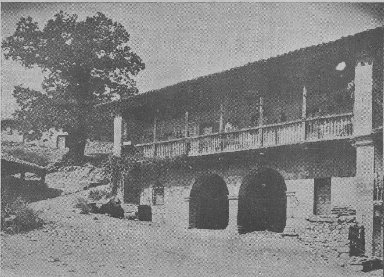
UNA INTERESANTE CASA TIPICA DE CARMONA (ABUERNIGA).