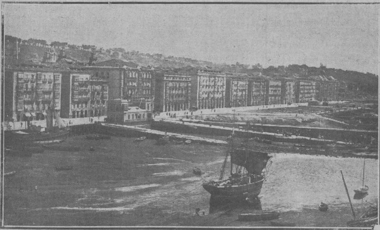
EL ANTIGUO SANTANDER.—Una de las fotografías que dan más idea del enorme progreso de la ciudad. He aquí la dársena en que hoy se alzan los jardines de Pereda, la rampa del Consulado, el pabellón de los prácticos y la Comandancia de Marina.

"Marinoni", doble reacción, para imprimir periódicos, se vende a precio conveniente. Esta Administración Informa.