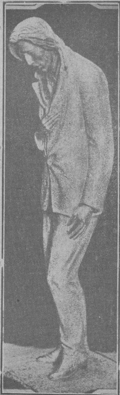
Estatua en bronce de Florencio Sánchez, por Agustín Riganelli.