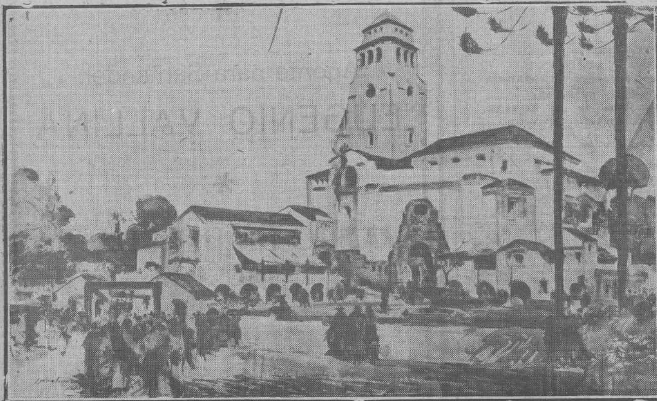
Proyecto del pabellón de Chile en la Exposición Iberoamericana, de Sevilla, obra del arquitecto don Juan Martínez Gutiérrez.

Adelante y salud a todos para que viva a su numerosa prole muchos años.