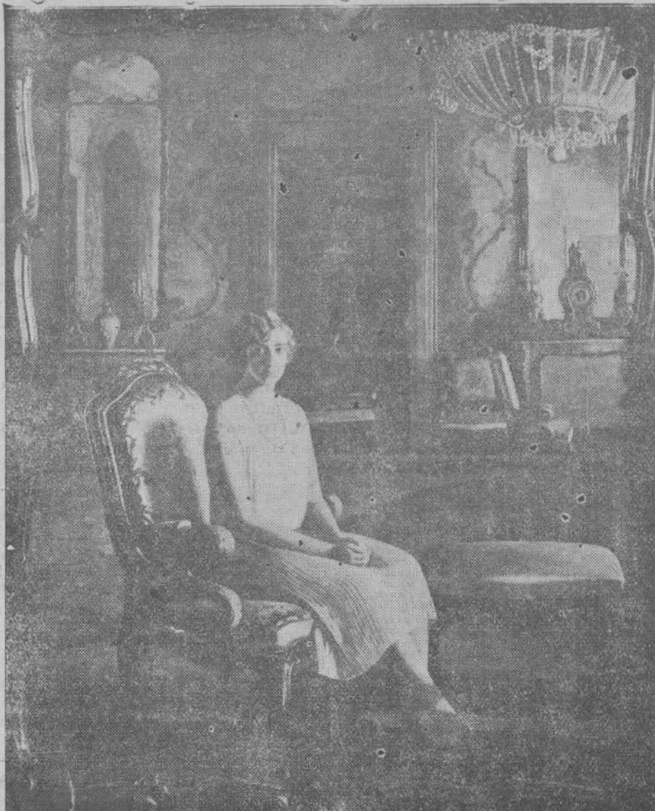
Retrato de la Infanta doña Beatriz, obra del notable pintor señor Benlliure.

Nuestra felicitación sincera al señor Benlliure.