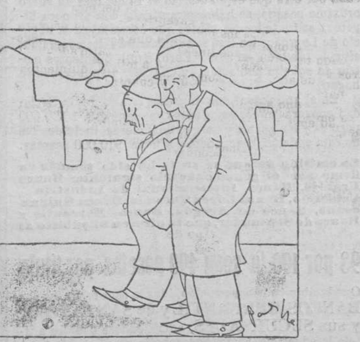
INTERPRETACION EQUIVOCADA —¡Oh! Siempre que veo unas piernas, así me acuerdo de mi juventud. —¿Caramba, don Cosme! ¿Tuvo usted las piernas bien hechas? (Prohibida la reproducción)