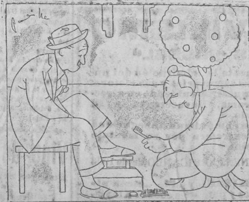
—¿Y qué opina tú del Racing?— —Pues, «na», ¡qué voto por la Directiva! —¡Cuidado! No te vaya a oír «el círculo»!

La noche, última del año 1929 pasó, fortunately, sin que se registrara ninguna desgracia, a pesar de que la cantidad de jurguistas que han desambulado vociferando por las calles de la ciudad, ha sido enorme.