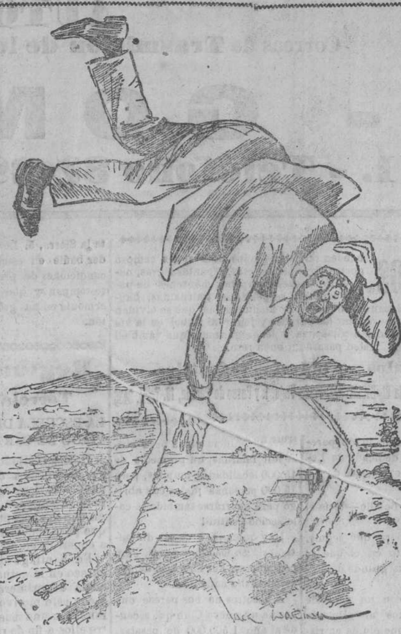
El aviador, inconsciente, precipitándose en el vacío: —¡Socorro...! ¡Socorro...!

También anuncia el régimen de nieblas espesas en la costa portuguesa.