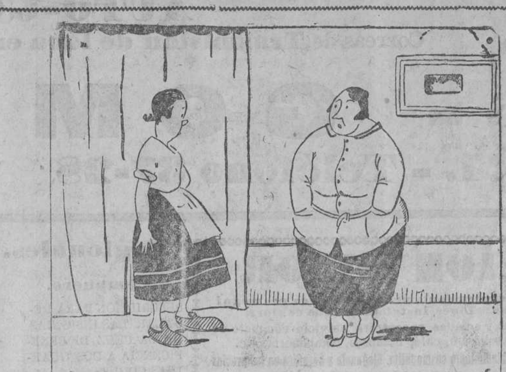
LOS ESCRUPULOS DE NEMESIA