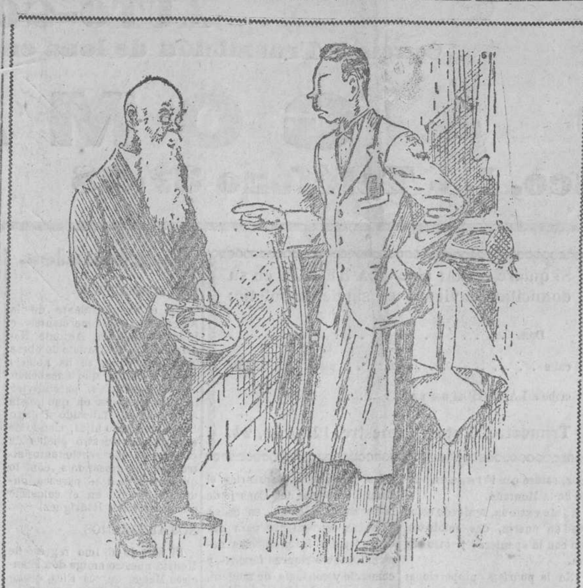
—Venía a decirle a usted que con el específico que me dió para teñirse el pelo, se me ha caído todo. Vea usted la cabeza. —Ya le dije que no le quedaría ni una cana cuando se lo diera.

En el Ateneo Popular. Mañana viernes dará una interesante conferencia el presidente de la Diputación.