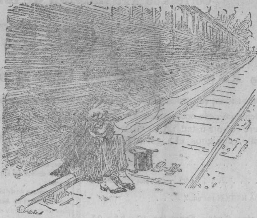
El suicida (que se ha equivocado de vía)... ¡Caramba, pues no hace tanto daño el tren como decían!

«La Soledad».—Funeraria de Llama Hermanos, Burgos, 45. — Tel. 15-35