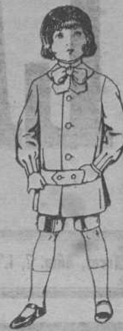
TRAJES MODELO CASACA para niños 4 PESETAS 12