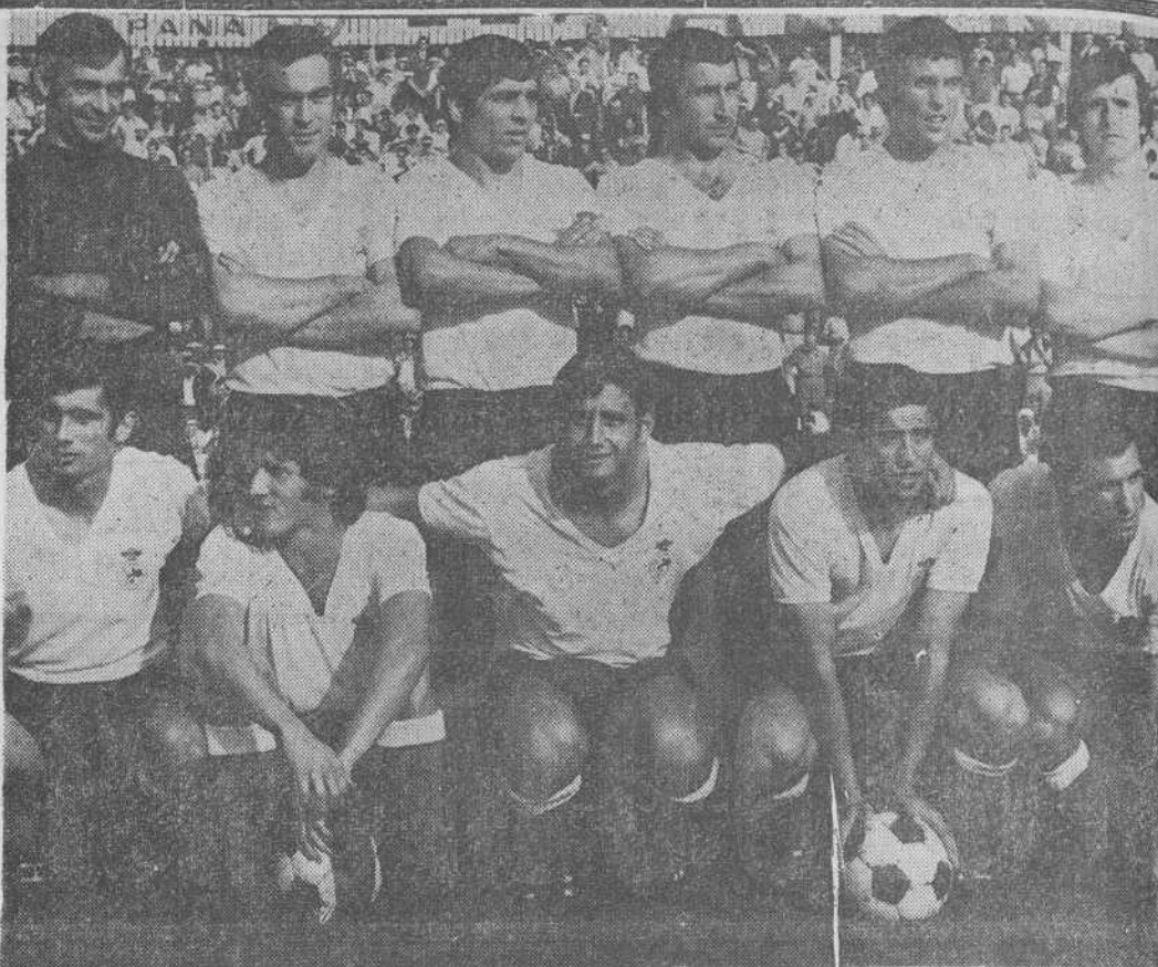
Uno de los últimos conjuntos del Real Santander.

Su dominio como ya ha quedado señalado— vino facilitado por la debilidad forastera en su ataque por la actitud defensiva que adoptó el Racing. Pero no hubo méritos, más que para una victoria mínima. Y es que mientras el Santander logró realizar el encuentro que le convenía, el Salamanca no consiguió dar con la fórmula de salvar los dos goles en contra que saltó al campo.