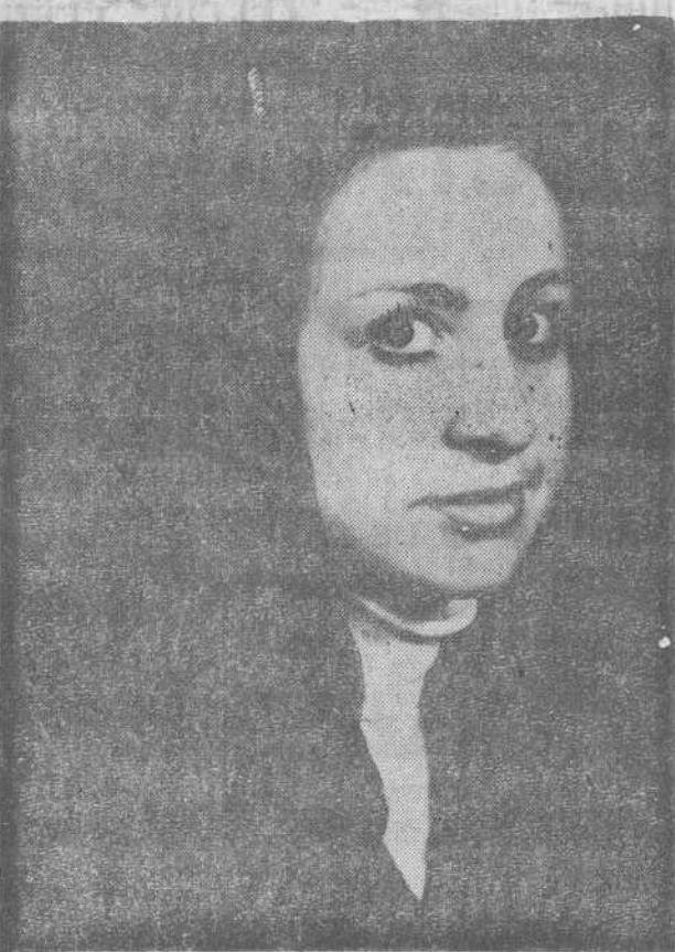
(INFORMACION EN SEXTA PAGINA)