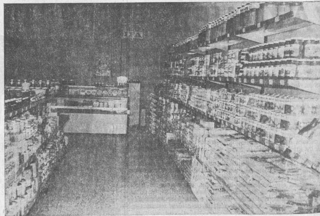
Autoservicio "Galicia" - Torrelavega.

Equipe su hogar sin gasto alguno con cupones "IFAPRIX"