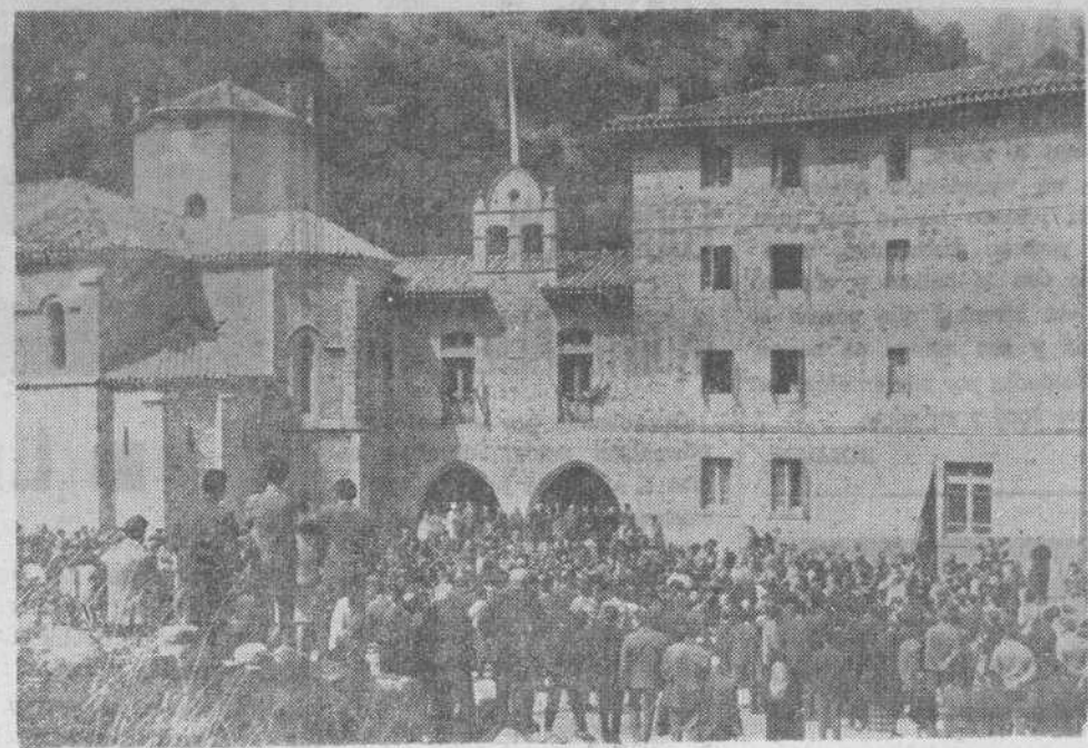
Extraordinaria jornada la de ayer en Santo Toribio de Liébana, con motivo del año jubilar. El buen tiempo parece que va estabilizándose y miles de personas se trasladaron este domingo al célebre Monasterio para ganar el jubileo postrándose y orando ante el Lignum Crucis. Durante toda la mañana las carreteras que conducían al Liébana registraron un inusitado paso de vehículos en dirección al Santuario y procedentes de toda nuestra provincia y de Vizcaya, León, Asturias, Valladolid, Palencia, Burgos, etcétera, aparte de un buen contingente de extranjeros. En las misas y en la adoración de la venerada reliquia el amplio e histórico templo se vio abarrotado de fieles.