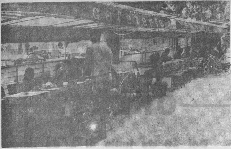
Como la piedra en un apacible lago cayó entre los santanderinos la pugna que sostienen el Ayuntamiento y los bares y cafeterías en torno a las terrazas. Por un lado se quiere exigir mayor contribución a dichos establecimientos; por otro, éstos consideran que es desorbitada la pretensión municipal.

caso, porque sus repercusiones tendrán consecuencias imprevisibles y, desde luego, afectarán a la masa de consumidores que pagan siempre los vidrios rotos.