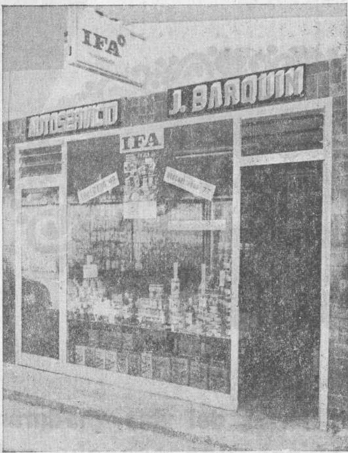
Autoservicio Barquín - Torrelavega.

Bombones "Nestlé", nuevo estilo, ESTUCHE 55,00