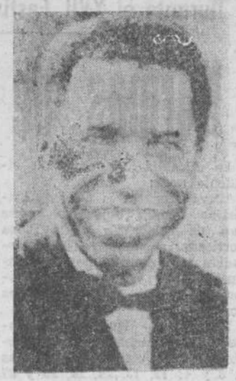
El Presidente Massemba-Debat, depuesto y repuesto en el Congo ex-francés.

Reconocimiento de Biafra Nigeria teme una invasión francesa Lagos. (Efe-Upi). —El Gobierno de Nigeria ha expresado su preocupación al encargado de Negocios francés, Raymond Cesaire, con respecto a los rumores de una posible intervención francesa en la guerra de Biafra, a favor de Biafra. En los medios informados se dice que el diplomático fue llamado por el ministro de Asuntos Exteriores, doctor Okoi Arlkipo, para que contestase a las acusaciones de que paracaidistas franceses están acantonados en Gabón y dispuestos a entrar en Nigeria en cualquier momento. El ministro nigeriano dijo también que se cree que han sido enviadas armas francesas a las tropas biafresas en aviones, a través de Libreville. Añaden las fuentes informativas que Cesaire negó las acusaciones y manifestó que el reconocimiento de Biafra fue hecho solamente por razones humanitarias. El ministro recibió también a los embajadores de la Unión Soviética, de Alemania y de Gran Bretaña.