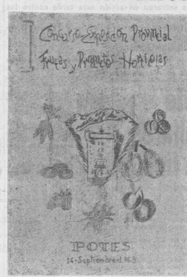
Cartel anunciador del Concurso de Fruticultura y Horticultura que tendrá lugar en Potes en el mes de septiembre. El dibujo es original de don José María Queimadellas.

Sexta. — Los productos exhibidos quedarán a favor de la Comisión organizadora, que los destinará a un centro social-beneficente.