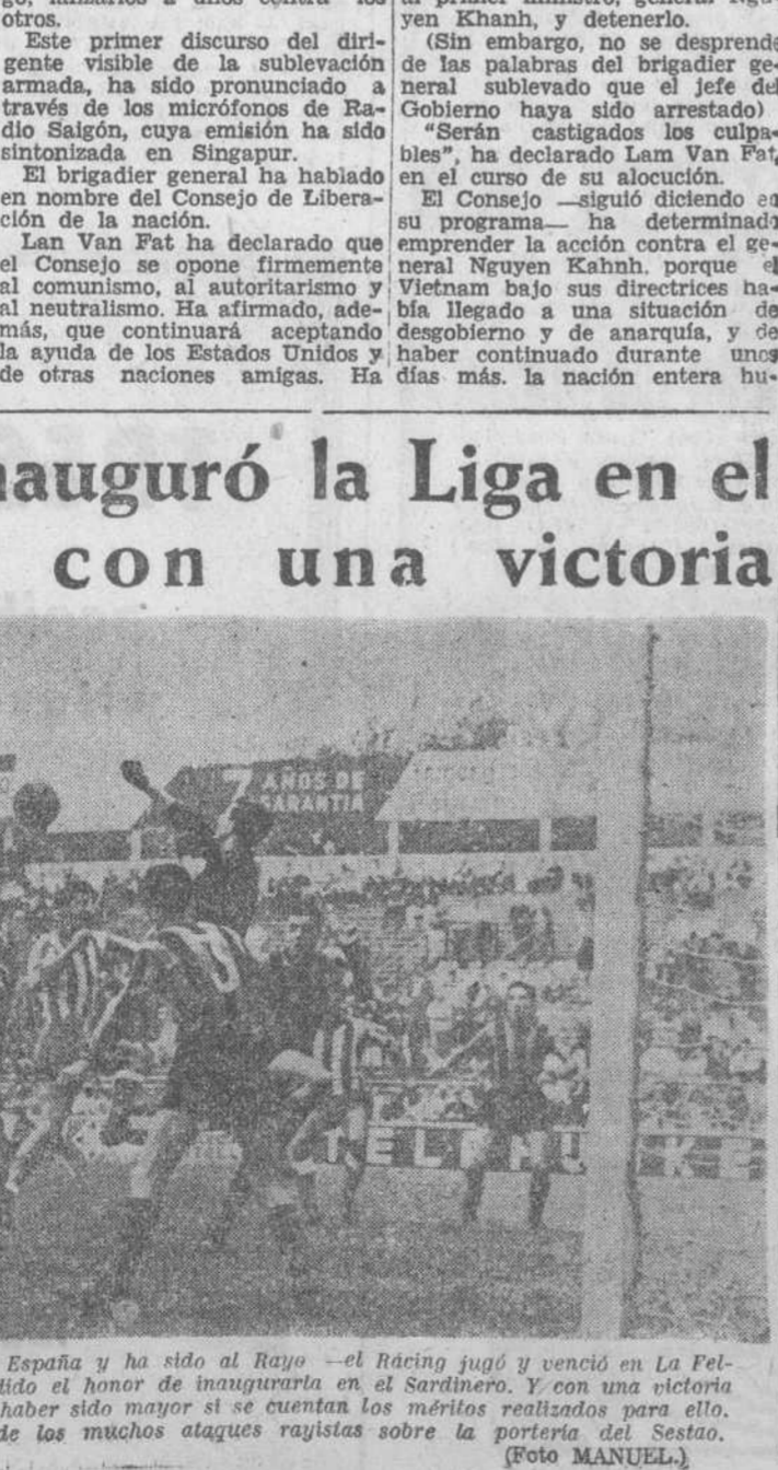
La Liga comenzó ayer en toda España y ha sido el Rayo —el Racing jugó y venció en La Felguera— al que le ha correspondido el honor de inaugurarla en el Sardinero. Y con una victoria contundente, 4-2, que sin duda haber sido mayor si se cuenta los méritos realizados para ello. En la presente fotografía, uno de los muchos ataques rayistas sobre la portería del Sexto.

nivel de vida es aumentar en medios económicos. Y eso es una visión muy corta e incompleta, pues con las riquezas —lo mismo que ocurre con todas aquellas cosas que no son más que un medio— pueden hacerse muchos bienes, pero pueden producirse inmensos males. (Pasa a tercera página.)