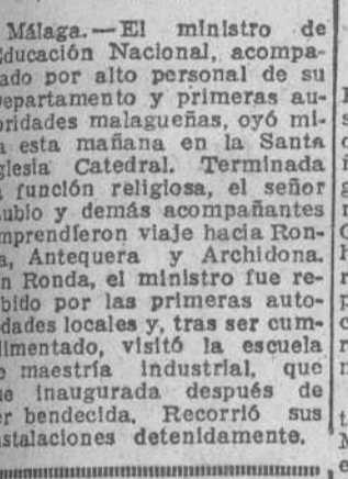
Don Jesús Rubio García-Mina, ministro de Educación Nacional.

En Antequera y Archidona efectuó varias visitas Seguidamente, el ministro marchó a Antequera, donde recorrió diversos monumentos locales y visitó varios centros dependientes de su Ministerio. Tras la visita a esta última localidad, el señor Rubio visitó Archidona, donde en el Instituto Laboral, que es también el centro docente del ministro, inauguró el nuevo campo de prácticas y realizó una detenida visita a sus instalaciones, terminadas las cuales emprendió viaje a Málaga. (Cifra.) El ministro regresó a Málaga a las ocho de la noche, donde fue despedido en el hotel por las autoridades que le habían acompañado en su viaje hacia Almuñécar, donde permanecerá, para continuar mañana con dirección a Almería. (Cifra.)