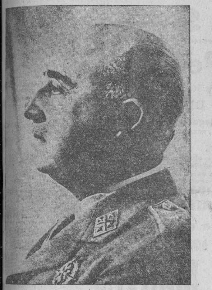
La inauguración del nuevo pueblo de Agueda del Caudillo, y entrega de los títulos y las llaves a los nuevos propietarios.

Todo lo que hay de grande en España, es obra de la nación disciplinada y en orden