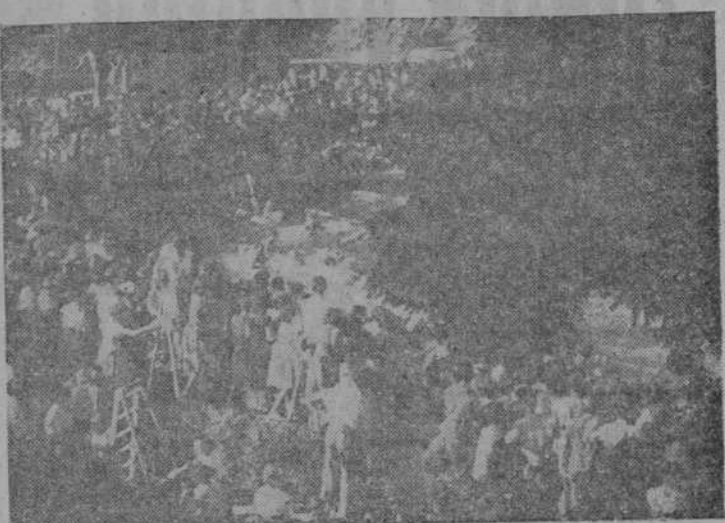
Un aspecto de la piscina de La Alamedilla durante los concursos de natación.

A las cuatro de la tarde comenzaron a sonar los prime-