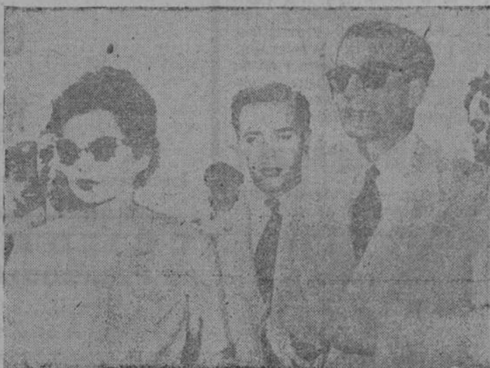
El Sha de Persia y su esposa la reina Soraya se han reunido nuevamente en Teherán, adonde ella llegó en estos días procedente de Roma