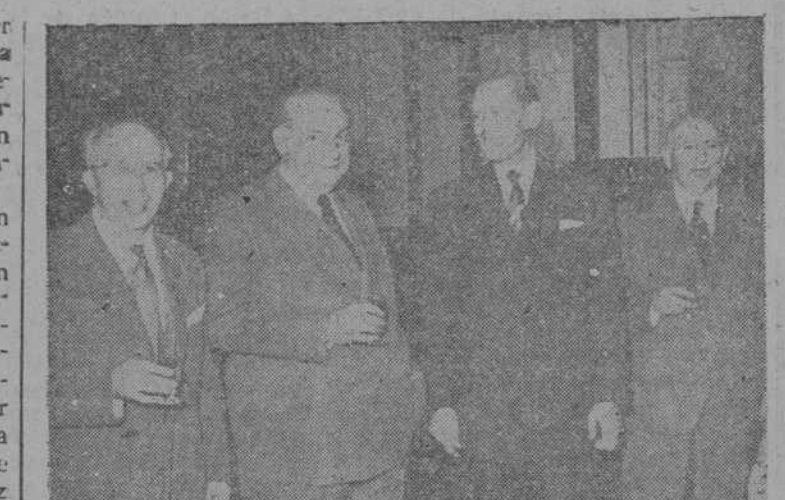
El alcalde con algunos congresistas ferroviarios de España y Portugal, durante la recepción

Como anunciábamos, ayer comenzó en nuestra ciudad la II Conferencia comercial ferroviaria España-Portugal, cuyas sesiones se celebraron en el salón de sesiones de la Casa Consistorial.