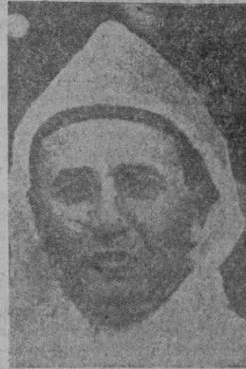
El sultán depuesto, cuya jefatura asumirá ahora el Consejo de visires.

Rabat.—Oficialmente se informa que los disturbios más graves se han registrado en Uxda, donde resultaron muertos tres legionarios siete europeos, tres judíos, un policía y cuatro marroquíes, así como numerosos europeos heridos. (Efe.)