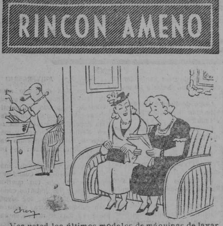
—Vea usted los últimos modelos de máquinas de lavar. —Yo tengo ya lo que me hace falta.