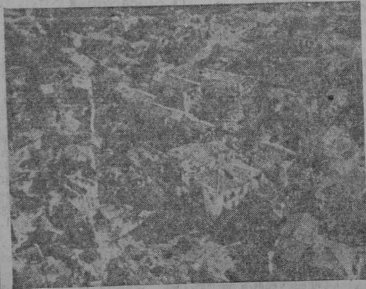
Vista aérea de la ciudad de Argostolion, que ha sufrido treinta y cuatro terremotos seguidos, que la dejaron reducida a escombros, siendo escasos los muros y tejados que permanecieron en pie