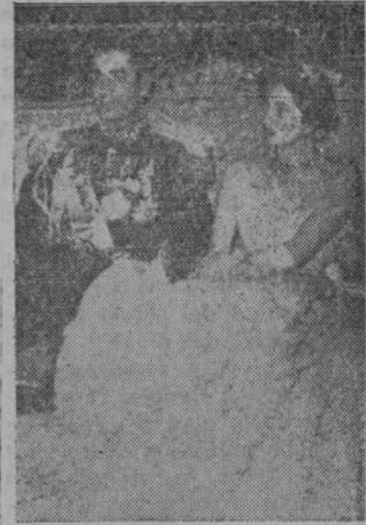
Aparecen aquí juntos el sha de Persia y su esposa, Soraya, que con motivo de los recientes incidentes han salido de su país, refugiándose en Bagdad, dirigiéndose después a Londres.

Teherán.—Masas frenéticas, con picos, martillos y palos, se reúnen en los principales puntos de la capital, derribando las estatuas del sha y de su padre, sirviéndose de cuerdas atadas a camiones pesados. Las tropas y la policía no evitan estas tropelías de la multitud, que aclama constantemente a Mussadeq.