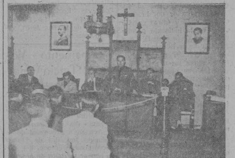
El gobernador civil dirige la palabra a los assembleístas durante la reunión plenaria celebrada el domingo en Peñaranda de Bracamonte.