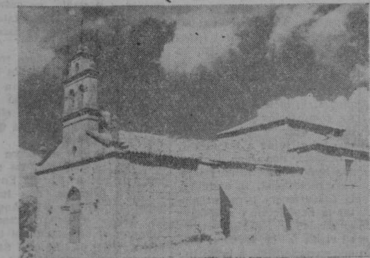
La ermita de la Virgen del Castillo

De madrugada nos comunican del Sanatorio que el estado del herido seguía siendo gravísimo, sin que todavía pudiera adelantarse nada acerca de la inmediata evolución de las graves lesiones que le produjo la fuerte descarga eléctrica.