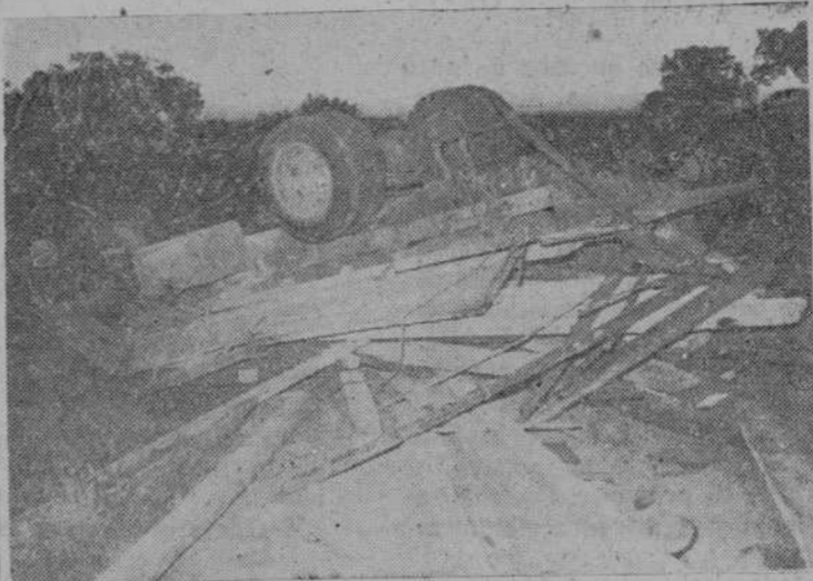
Así quedó el camión después de dar una aparatosa vuelta de campana. La cámara de nuestro fotógrafo — que pasó por allí a los pocos minutos de ocurrir el suceso — recogió toda la espectacularidad del suceso, con la cabina del vehículo totalmente aplastada contra el suelo, según puede apreciarse en la parte izquierda del grabado

Sus dos ocupantes sólo sufrieron lesiones de carácter leve