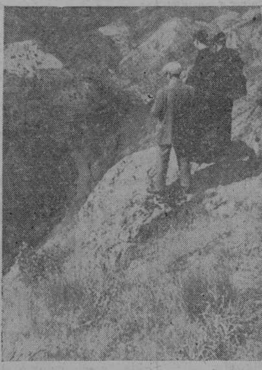
Contemplando el Duero a su paso por Pereña

Todo es grandiosidad, pero dulce y apacible, contrastando