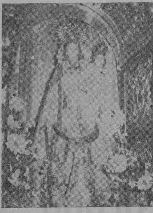
La imagen de Nuestra Señora del Castillo

zando inverosímilmente el Duero, llegan desde los pueblitos portugueses.