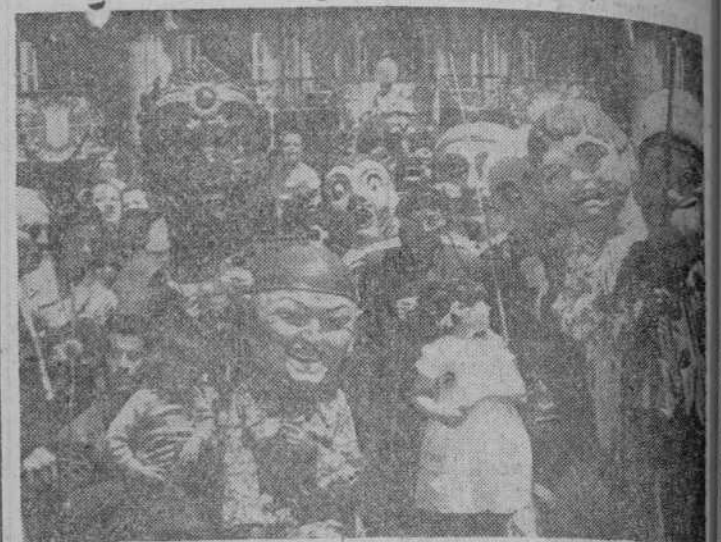
El padre Lucas y la Lechera, con los nuevos gigantes que ayer recorrieron las calles de la ciudad

Presidían el acto, el Pleno Municipal, con bandera y banda a mbarres; magistrado de Trabajo, señor Mendoza; presidente provincial de la Cruz Roja, señor Mirat; inspector provincial de Sanidad,