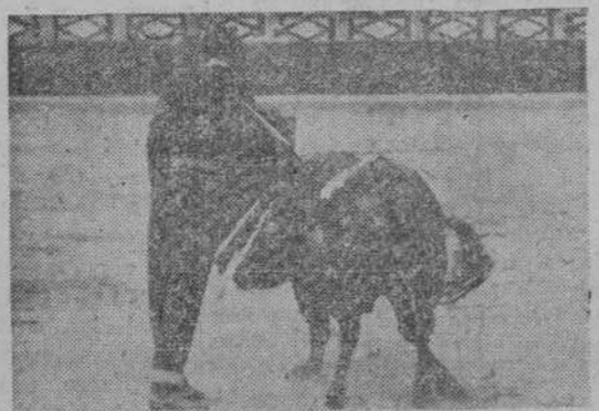
Juan Silveti