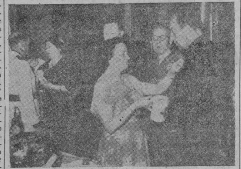
Durante la recepción en el Ayuntamiento, distinguidas damas de la Cruz Roja imponen el emblema de la institución a las autoridades

A la misma hora, los concejales, señores Sagrado, Víctor Hernández, Córdón y Crespo, presidieron la comida en la Asociación Salmantina de Caridad.