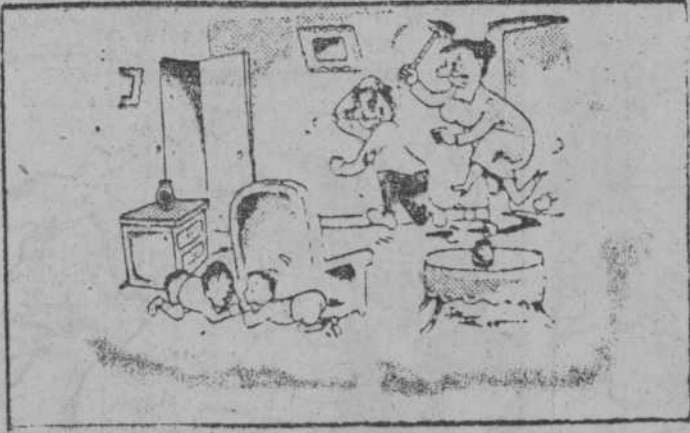
Un pez.—No pienso casarme. El otro.—Ni yo.