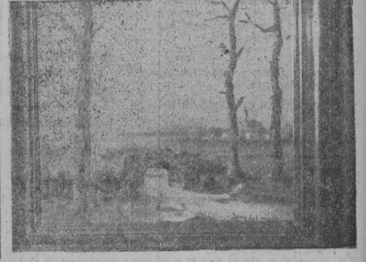
Este mismo límite que el ar...

Mañana, día 6, se inaugura, en la Sala "Artis", la Exposición del pintor belga Kreutzberg, primera que en esta sala tiene lugar de artistas extranjeros. Estará abierta hasta el día 25 del mes actual y podrá visitarse, como de costumbre, de doce y media a una y media, por las mañanas, y de cinco a ocho y media, por las tardes.